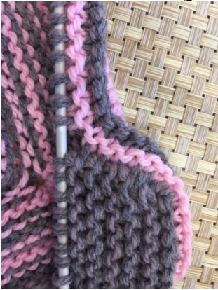
- Рисунок 2