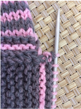
- Рисунок 3