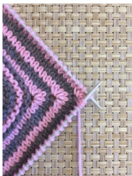
- Рисунок 1